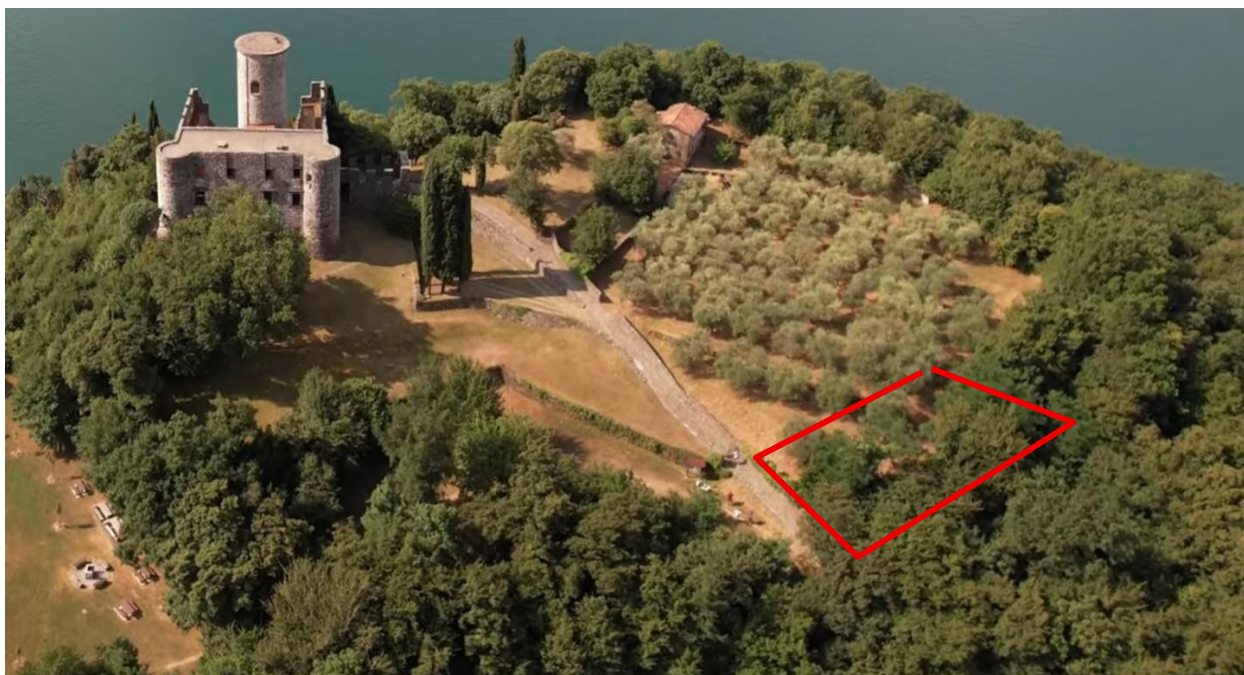
Fig. 2 – Foto

L'immobile non risulta essere stato interessato da pratiche edilizie