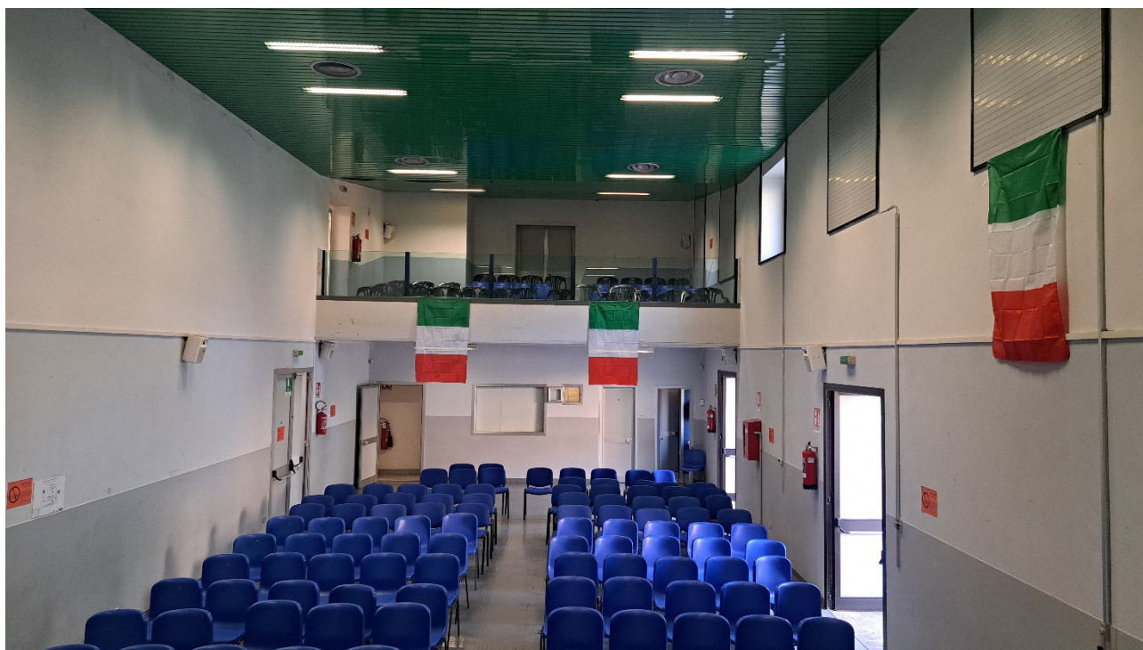
Sala polivalente vista dal palco