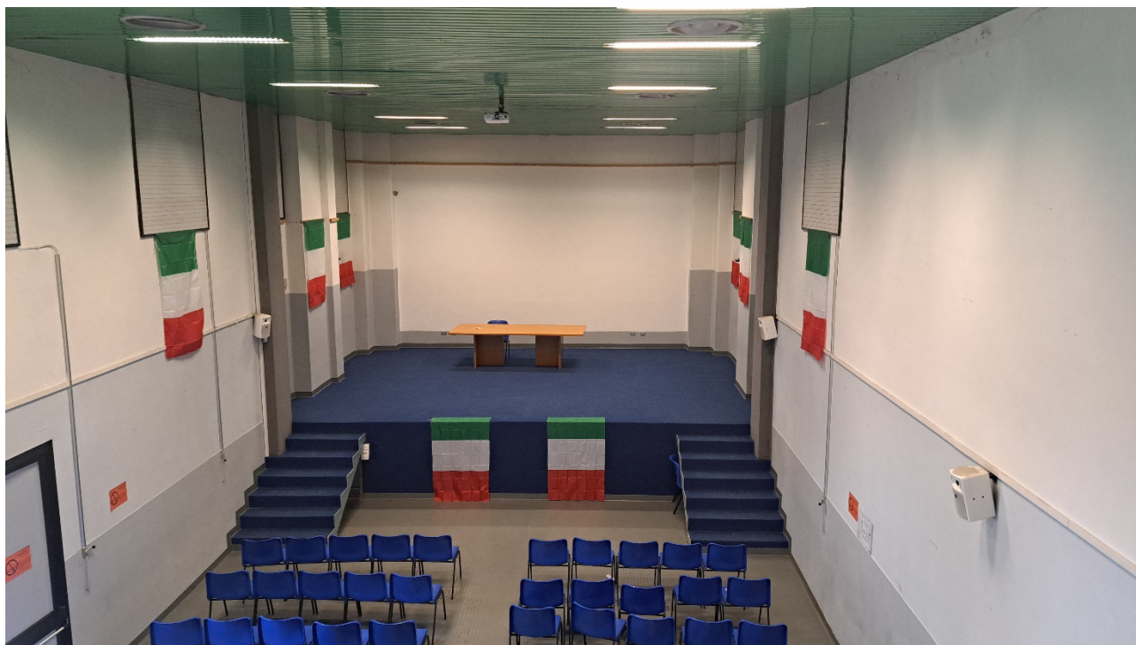
Sala polivalente vista dal soppalco