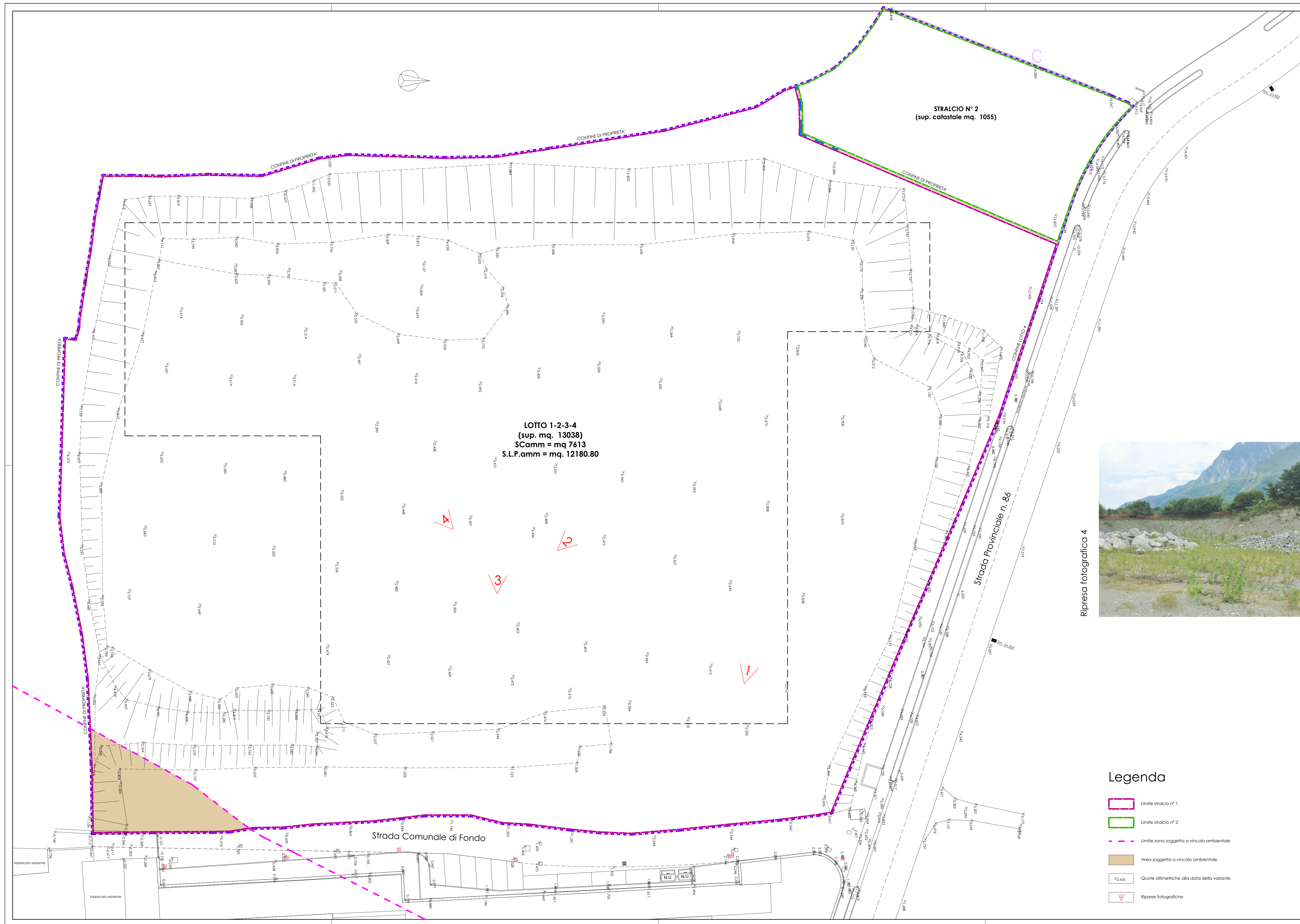
Ripresa fotografica 4