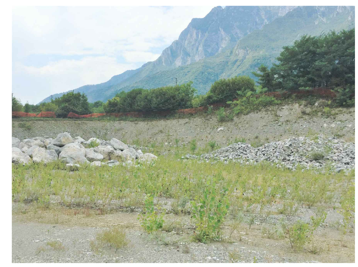
Ripresa fotografica 3