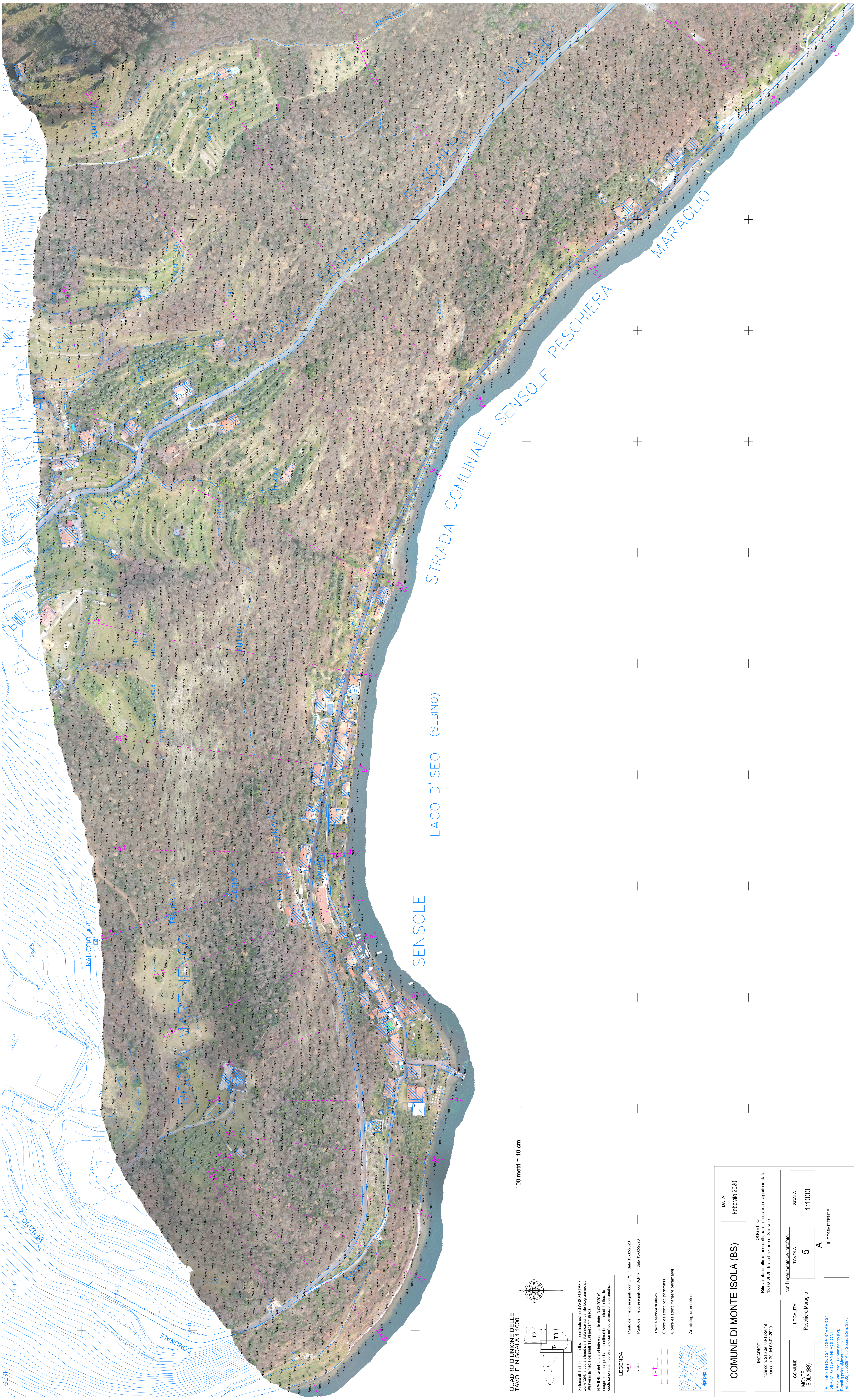
QUADRO DIVISIONE DELLE TAVOLE IN SCALA 1:1000