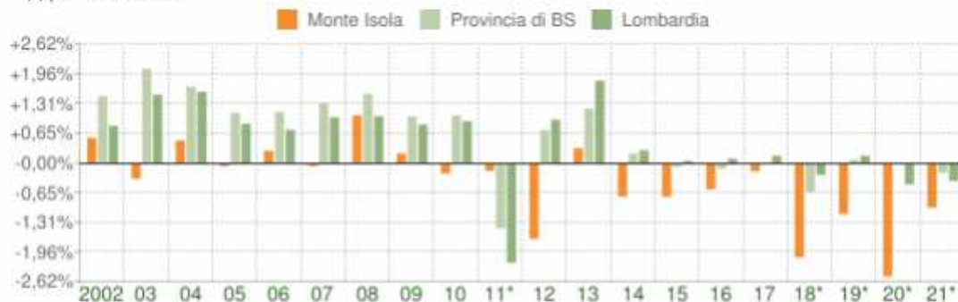
Variazione percentuale della popolazione