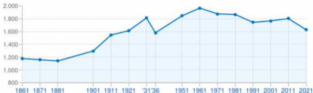
Popolazione residente ai censimenti

La popolazione residente, n. 1613 al 31.12.2023, in forte riduzione nonostante la pluralità di azioni anti spopolamento che l'Amministrazione Comunale ha attuato, in sinergia con altre istituzioni, per cercare di garantire i servizi di prima necessità.