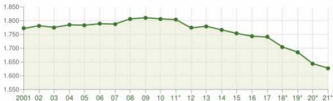
Andamento della popolazione residente

COMUNE DI MONTE ISOLA (BS) - Dati ISTAT - Elaborazione TUTTITALIA.IT