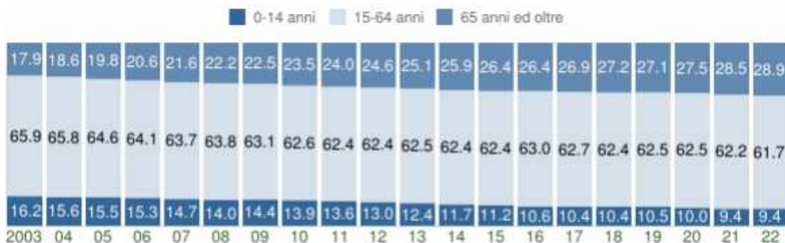
Struttura per età della popolazione (valori %) - ultimi 20 anni

COMUNE DI MONTE ISOLA (BS) - Dati ISTAT al 1° gennaio di ogni anno - Elaborazione TUTTITALIA.IT