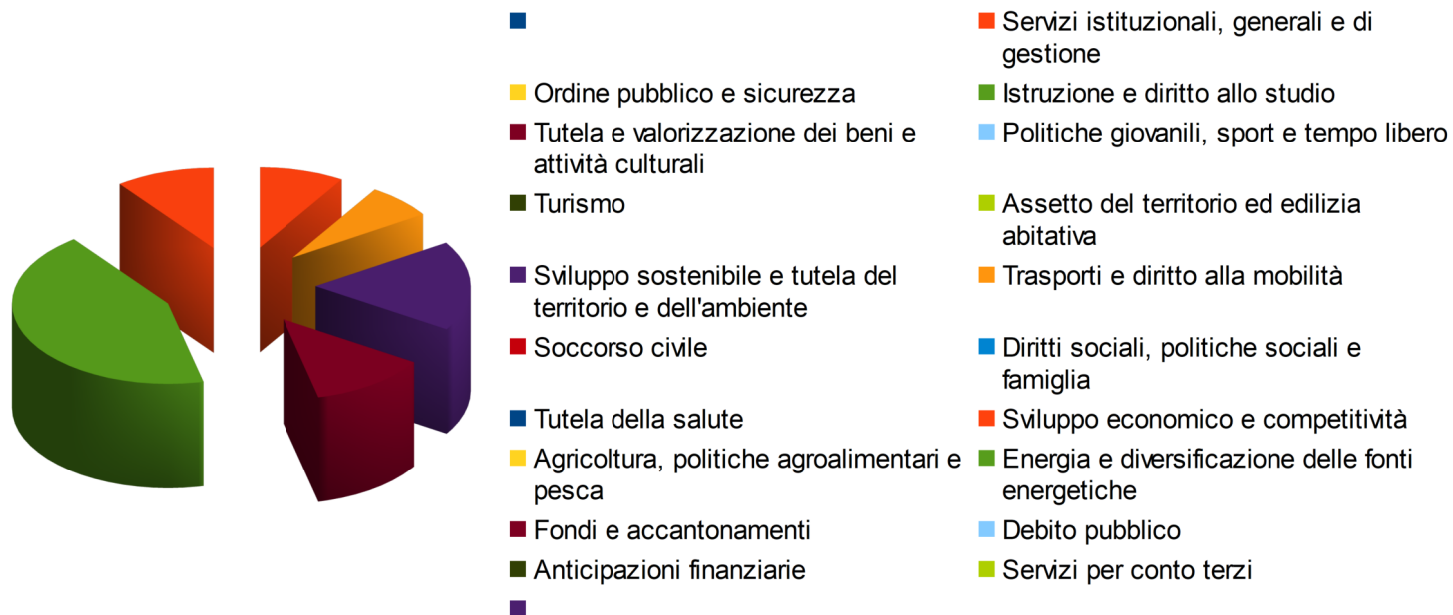
Diagramma 15: Parte capitale per missione