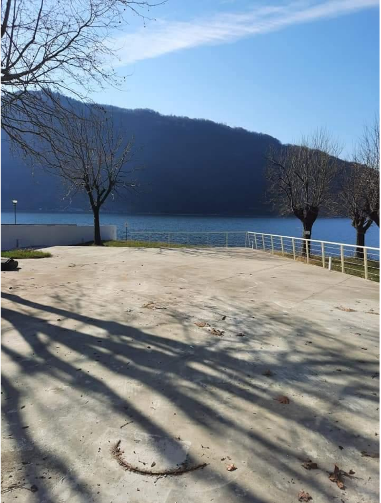
Plateatico a lago