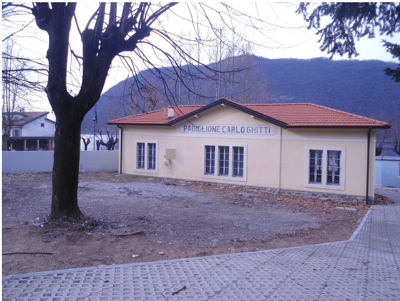
Esterno – Prospetto Est