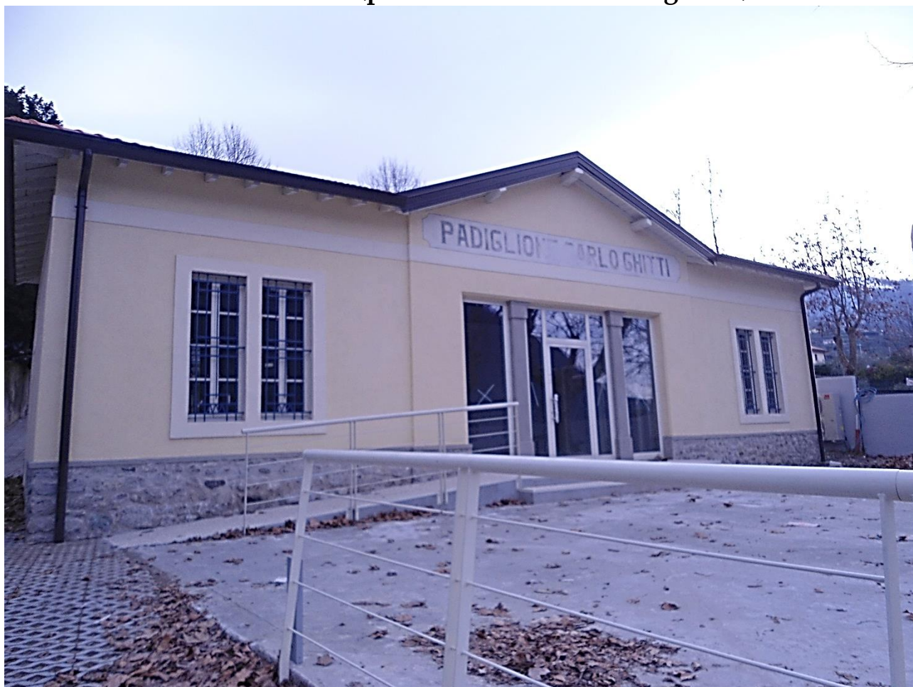
Esterno – Prospetto Est