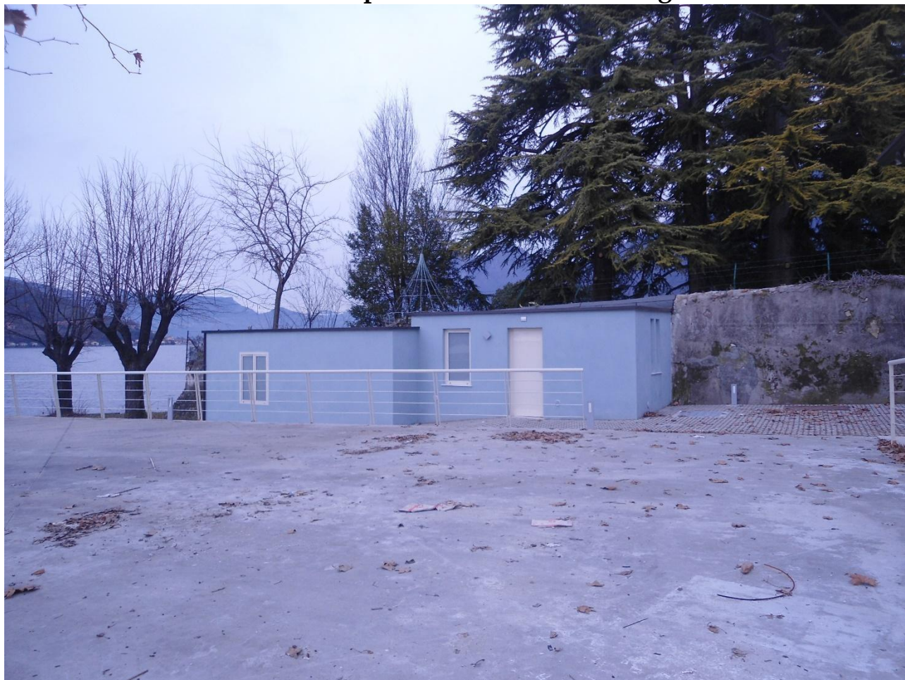
Padiglione B – Prospetto Sud