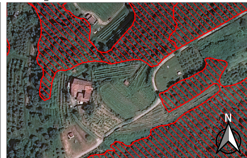
Ortofoto IT_2012 1:2.500