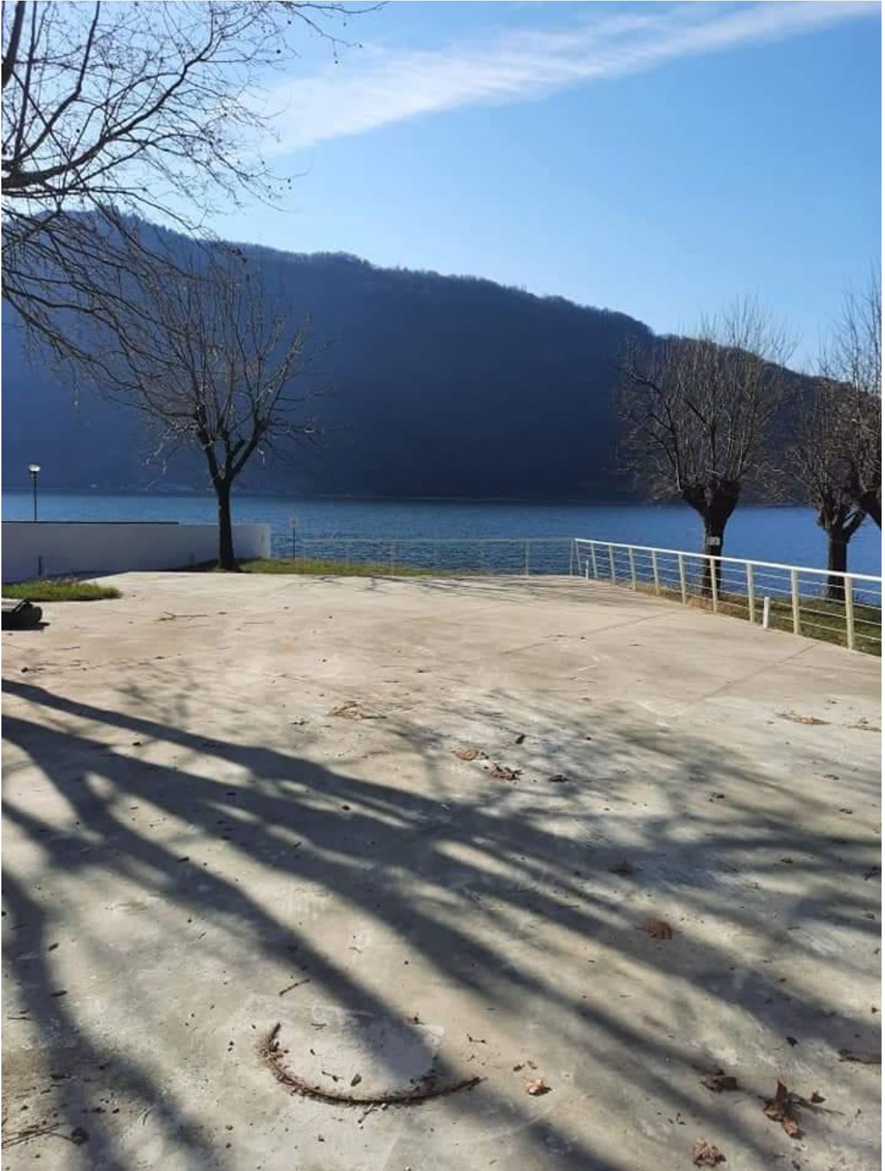
Plateatico a lago