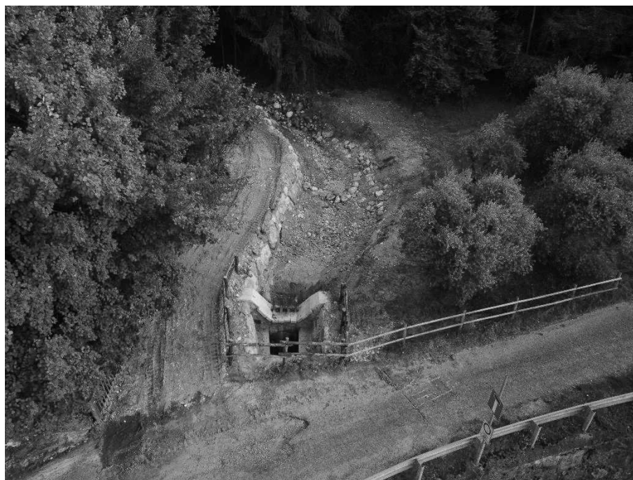
Foto 17: Veduta aerea dei lavori di ripristino della funzionalità idraulica dell'alveo e del tombotto di attraversamento di via Gazzane.

EVENTO FRANOSO CON ESONDAZIONE DEL TORRENTE MOLINI DEL 09 GIUGNO 2024 IN COMUNE DI SULZANO