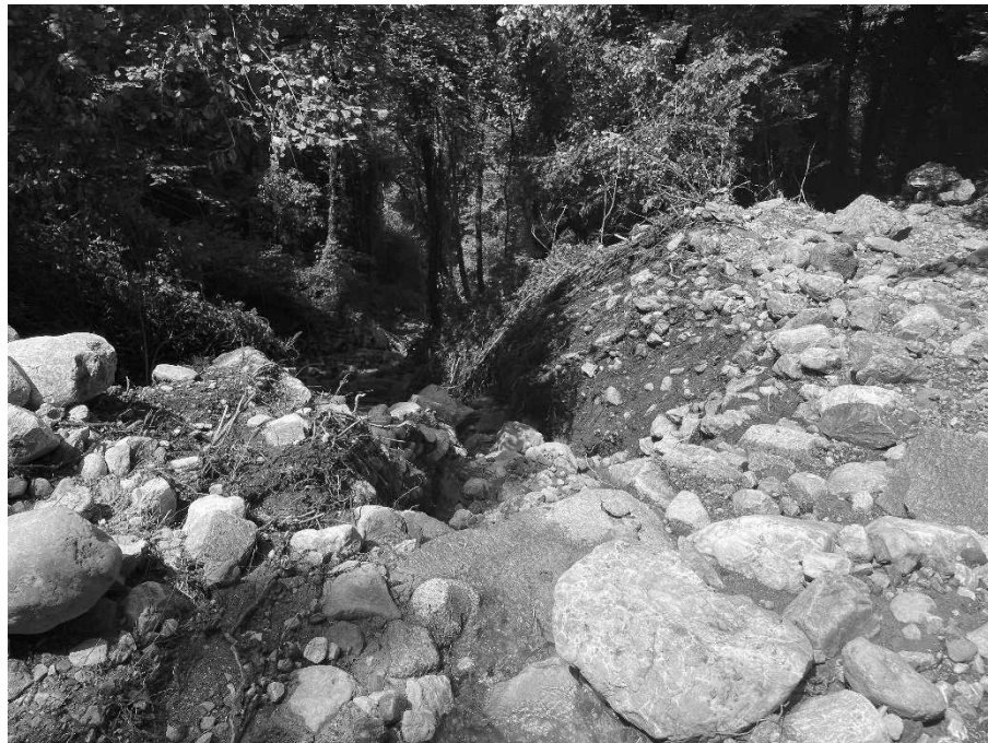
Foto 6: Valle Molini a valle dell'attraversamento della strada del Parlo (Faletto).