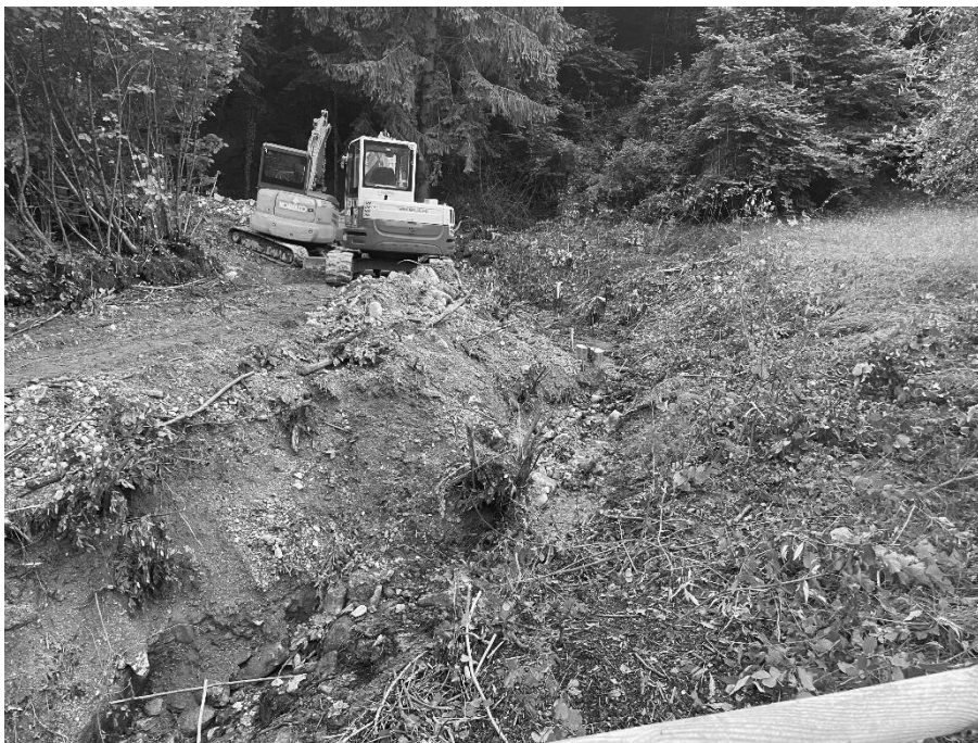
Foto 15: Lavori di svaso dell'alveo a monte dell'attraversamento di via Gazzane (310 m s.l.m.).

EVENTO FRANOSO CON ESONDAZIONE DEL TORRENTE MOLINI DEL 09 GIUGNO 2024 IN COMUNE DI SULZANO