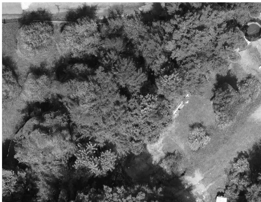
Foto 18: Veduta aerea ante opera dell'alveo della Valle Molini a monte di via Gazzane.