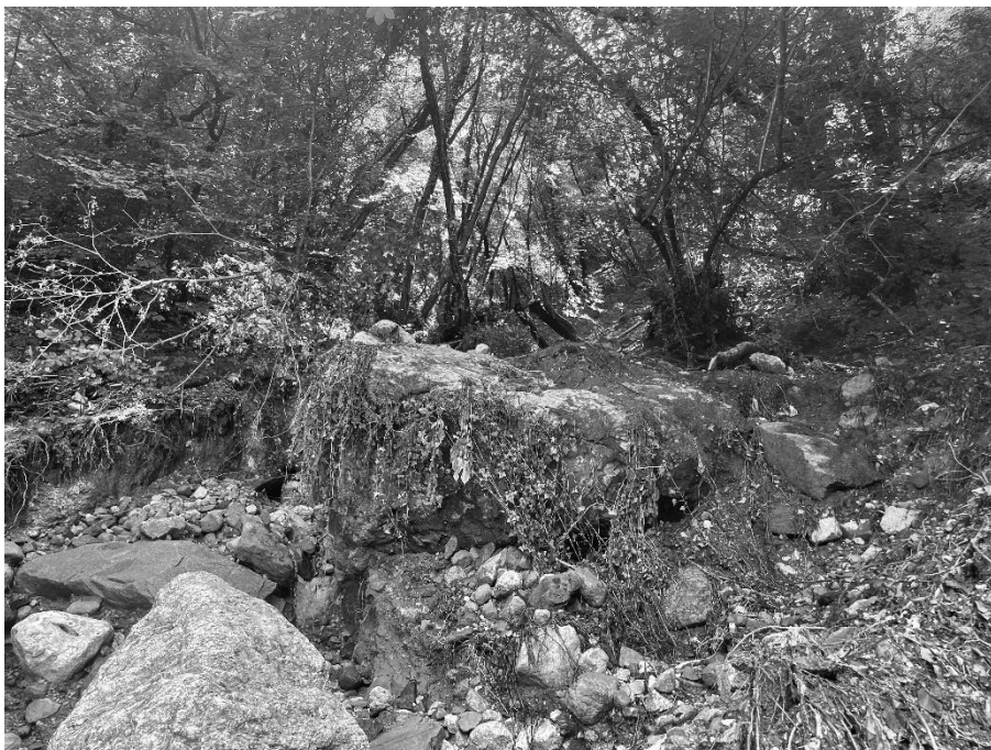
Foto 7: Valle Molini a monte dell'attraversamento della strada del Parlo (Faletto).

EVENTO FRANOSO CON ESONDAZIONE DEL TORRENTE MOLINI DEL 09 GIUGNO 2024 IN COMUNE DI SULZANO