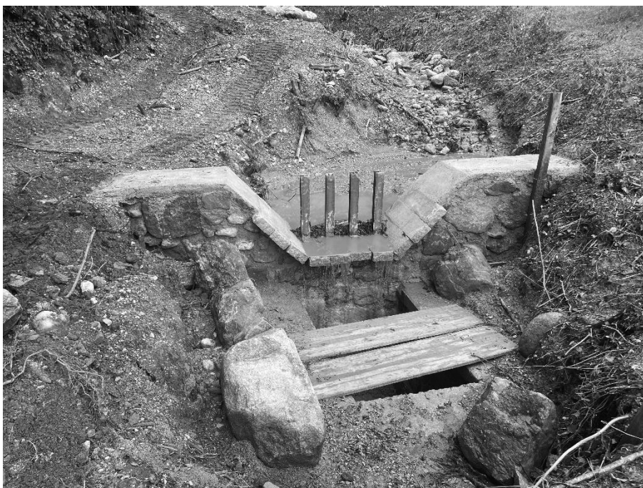
Foto 16: Lavori di ripristino dell'attraversamento di via Gazzane (310 m s.l.m.).