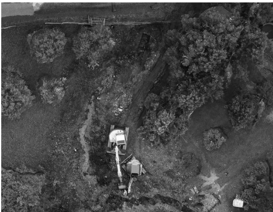
Foto 19: Veduta aerea in corso lavori dell'alveo della Valle Molini a monte di via Gazzane.

EVENTO FRANOSO CON ESONDAZIONE DEL TORRENTE MOLINI DEL 09 GIUGNO 2024 IN COMUNE DI SULZANO