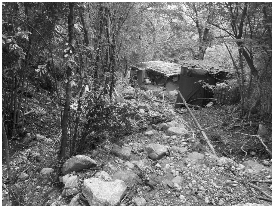
Foto 13: Valle Molini a monte di via Gazzane (320 m s.l.m.) esondazione e deposito materiale lioide.

EVENTO FRANOSO CON ESONDAZIONE DEL TORRENTE MOLINI DEL 09 GIUGNO 2024 IN COMUNE DI SULZANO