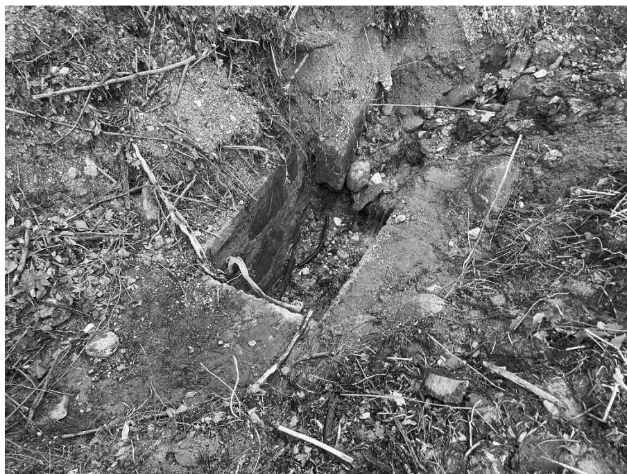
Foto 14: Tombotto di attraversamento di via Gazzane (310 m s.l.m.) occluso durante l'evento alluvionale e ripristinato con il pronto intervento.