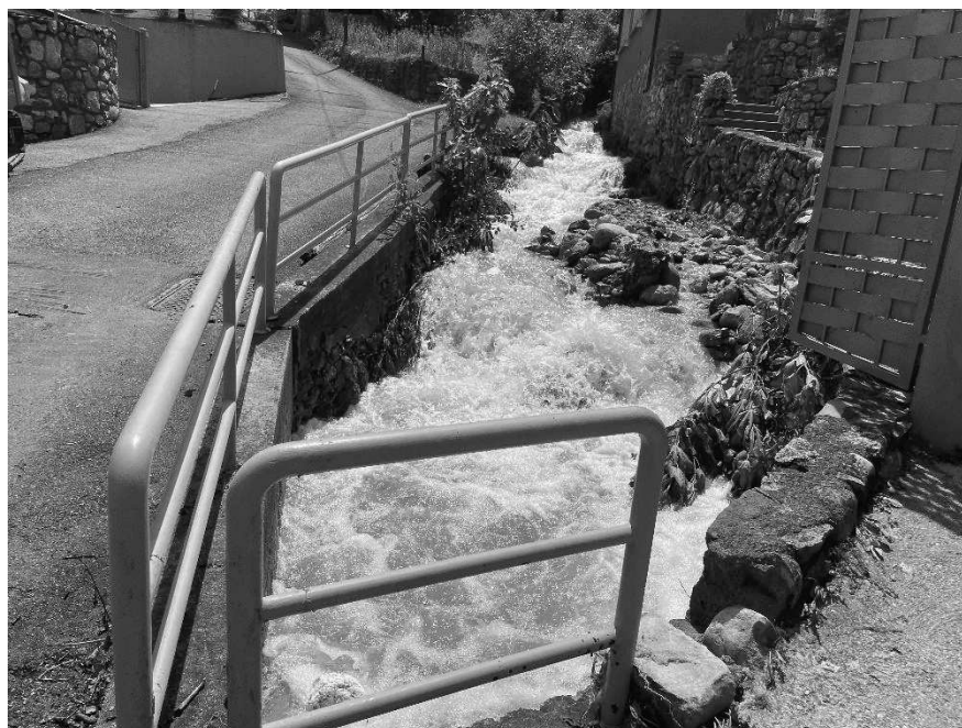
Foto 1: Valle Molini tratto esondato a monte dell'abitato di Sulzano (Via Molini).

EVENTO FRANOSO CON ESONDAZIONE DEL TORRENTE MOLINI DEL 09 GIUGNO 2024 IN COMUNE DI SULZANO