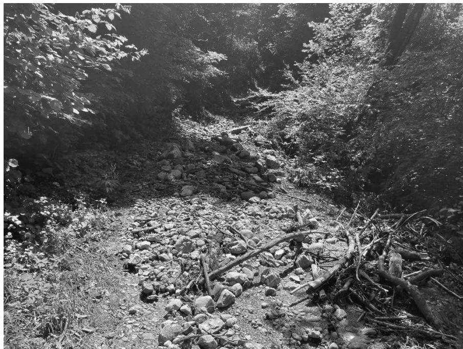
Foto 5: Erosione e deposito massi ciclopici su Strada del Parlo (530 m s.l.m.).

EVENTO FRANOSO CON ESONDAZIONE DEL TORRENTE MOLINI DEL 09 GIUGNO 2024 IN COMUNE DI SULZANO