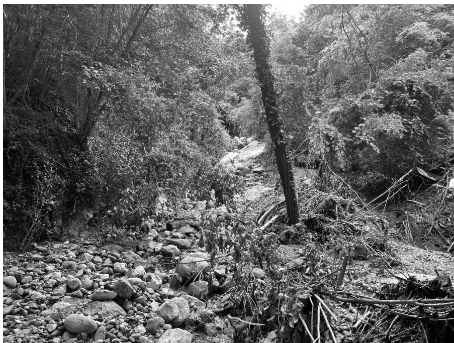
Foto 12: Valle Molini a monte di via Gazzane (320 m s.l.m.) esondazione e deposito materiale litoide.