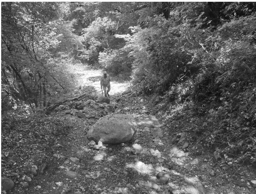
Foto 3: Erosione e deposito massi ciclopici su Strada del Parlo (530 m s.l.m.).

EVENTO FRANOSO CON ESONDAZIONE DEL TORRENTE MOLINI DEL 09 GIUGNO 2024 IN COMUNE DI SULZANO