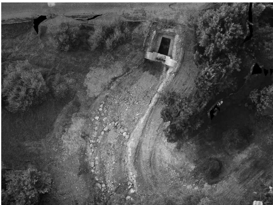
Foto 20: Veduta aerea post opera dell'alveo della Valle Molini a monte di via Gazzane.