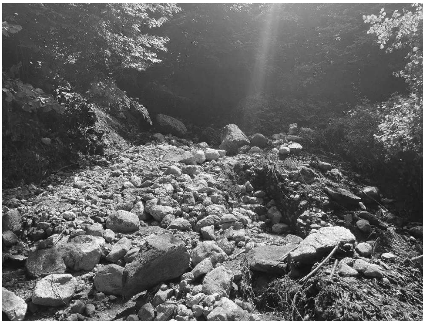
Foto 4: Valle Molini in corrispondenza dell'attraversamento della strada del Parlo (Faletto).