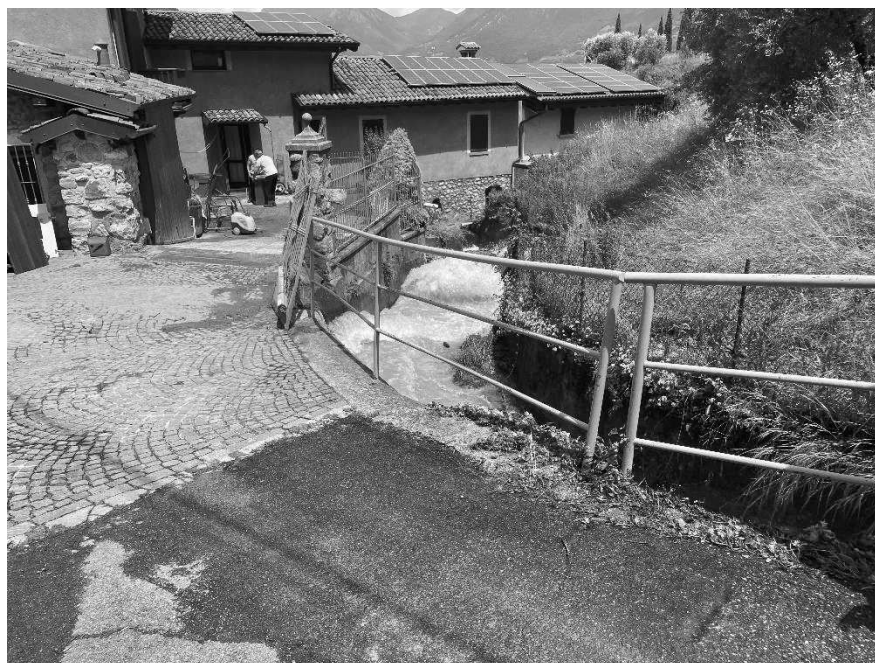
Foto 2: Valle Molini tratto esondato a monte dell'abitato di Sulzano (Via Molini).