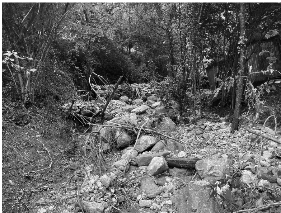
Foto 11: Valle Molini a monte di via Gazzane (320 m s.l.m.) esondazione e deposito materiale litoide.

EVENTO FRANOSO CON ESONDAZIONE DEL TORRENTE MOLINI DEL 09 GIUGNO 2024 IN COMUNE DI SULZANO