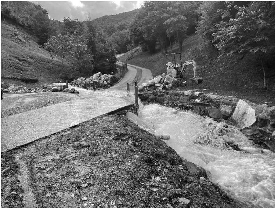
Foto 8: Valle Molini in corrispondenza dell'attraversamento della strada di collegamento tra Via Molini e il Dosso (275 m s.l.m.).