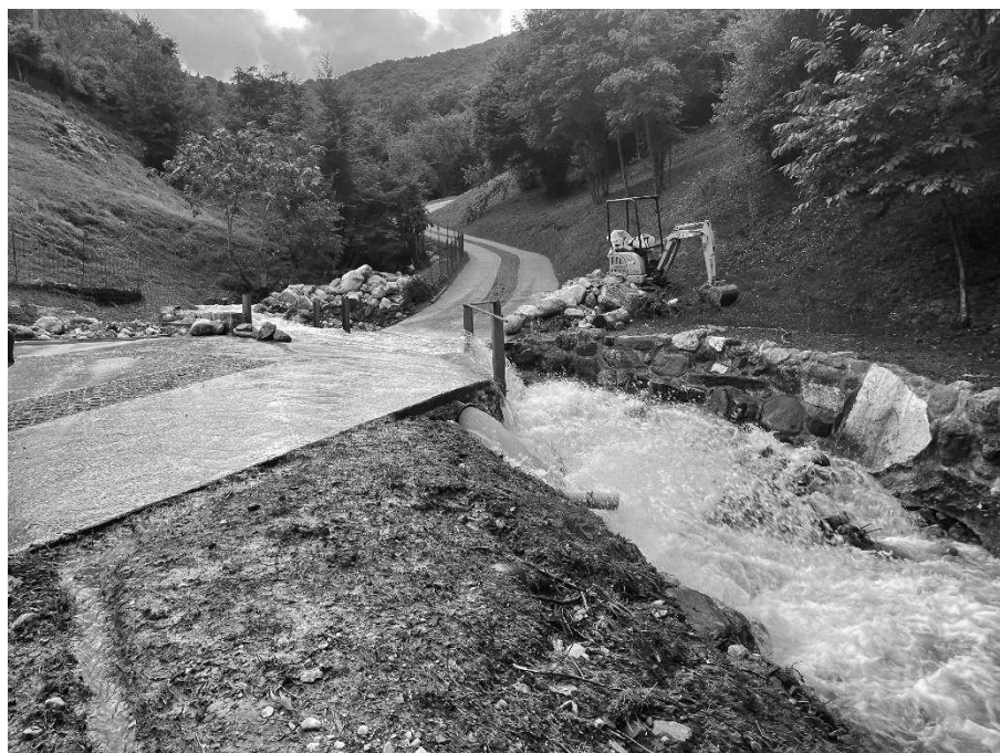
Foto 10: Valle Molini in corrispondenza dell'attraversamento della strada di collegamento tra Via Molini e il Dosso (275 m s.l.m.).