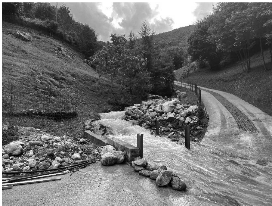
Foto 9: Valle Molini in corrispondenza dell'attraversamento della strada di collegamento tra Via Molini e il Dosso (275 m s.l.m.).

EVENTO FRANOSO CON ESONDAZIONE DEL TORRENTE MOLINI DEL 09 GIUGNO 2024 IN COMUNE DI SULZANO