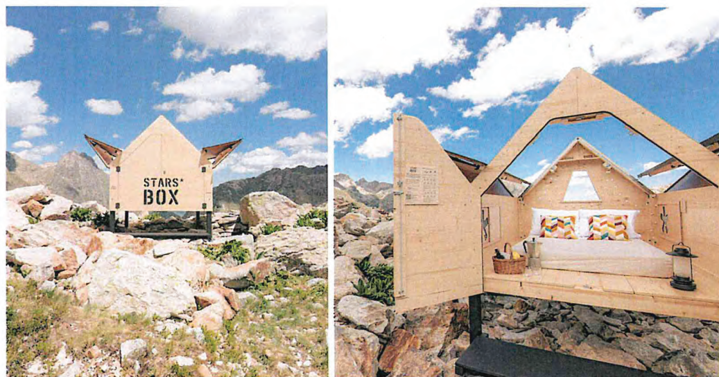
Foto3-4: da Località Pianrosso ORMEA (CN) – strutture di legno per ammirare le stelle www.starsbox.it/mongioie