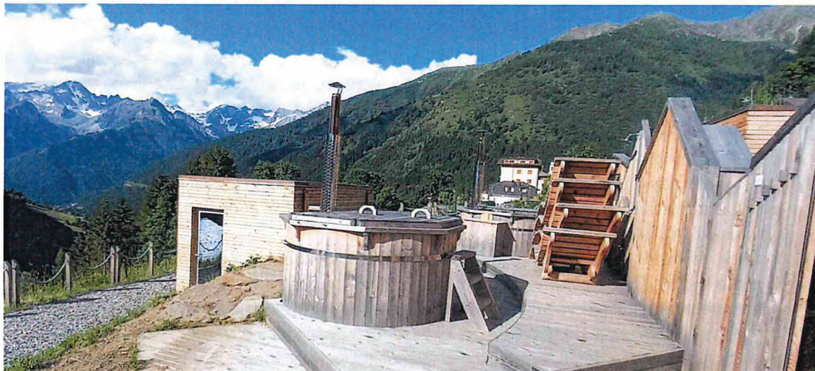
foto1: località Pezzo, tinozze d'acqua calde