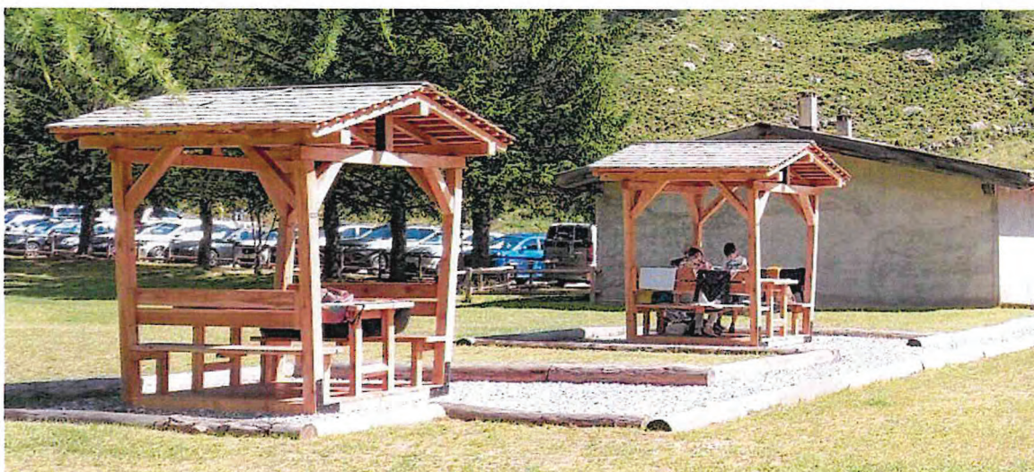
Foto2: località Santa Apollonia, strutture con coperture in scandole per protezione di tavoli