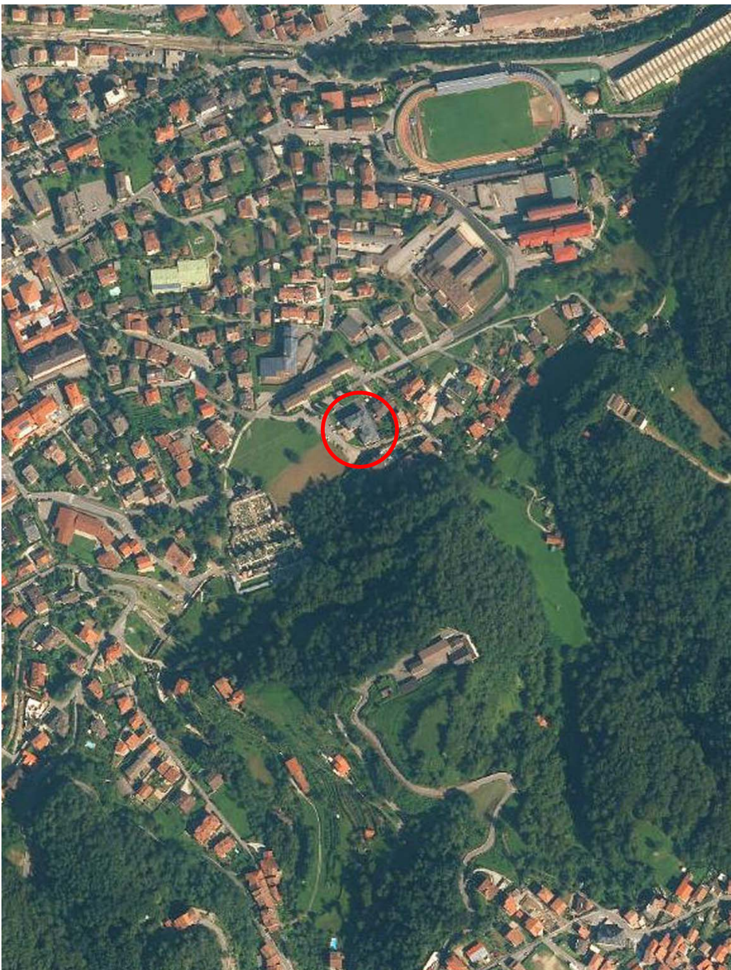
4 Estratto Ortofoto 1 : 10000