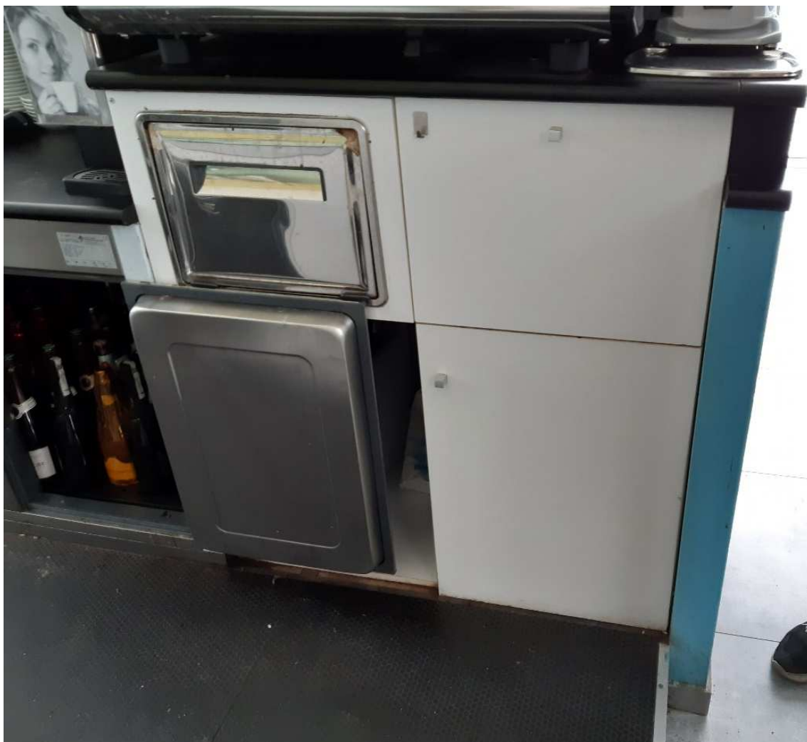
BANCONE BAR con pedana e Tramoggia fondi caffè