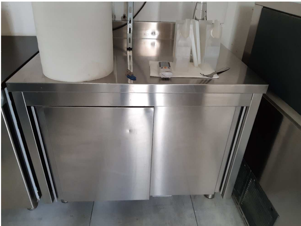
MOBILE IN ACCIAIO DUE ANTE SCORREVOLI