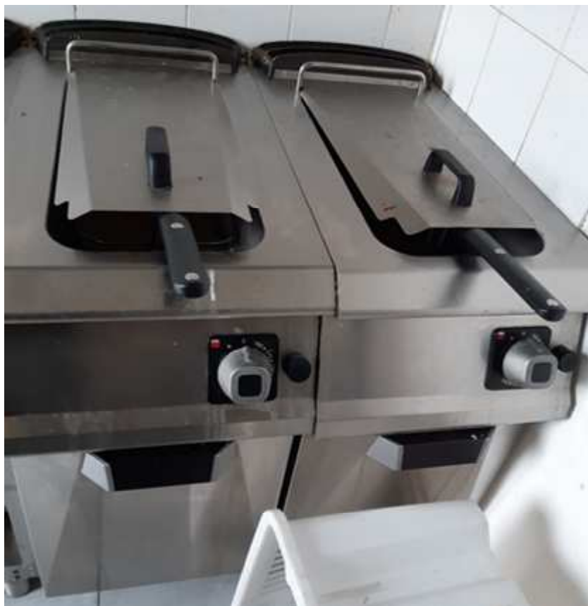
FRIGGITRICE A DOPPIA VASCA DA 15 LT CON RISCALDAMENTO A GAS