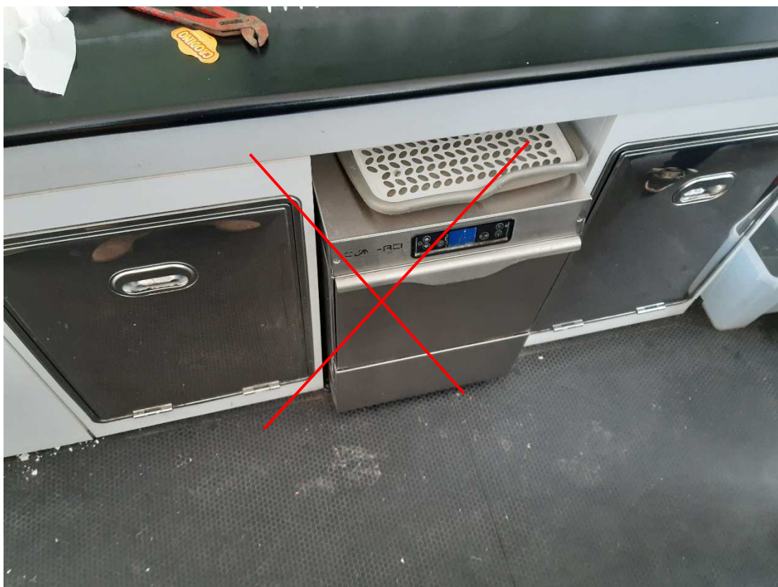
Mobile retrostante con due buche per rifiuti (esclusa lavastoviglie nella foto)