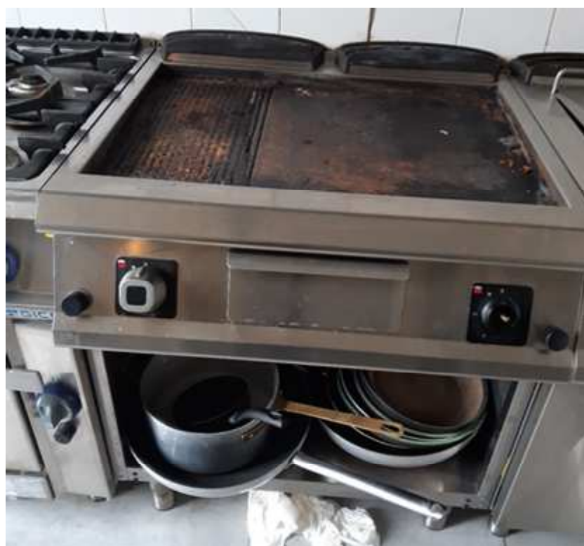
FRY TOP A GAS 1/3 RIGATO CON VANO SOTTOSTANTE