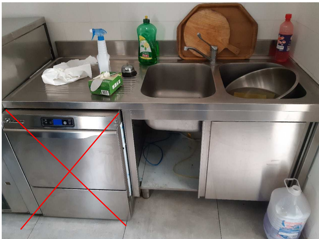
LAVANDINO E TAVOLO DI SUPPORTO SOTTOSTANTE – con esclusione della lavatrice