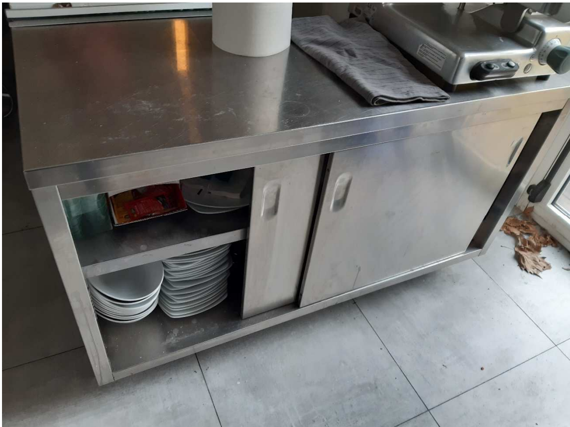
TAVOLO ARMADIATO CON TOP IN ACCIAIO E RIPIANO INTERMEDIO - DIM 1400x700x900mm.