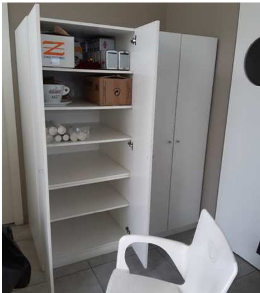
ARMADIETTA A 4 ANTE (laminato bianco): n. 2