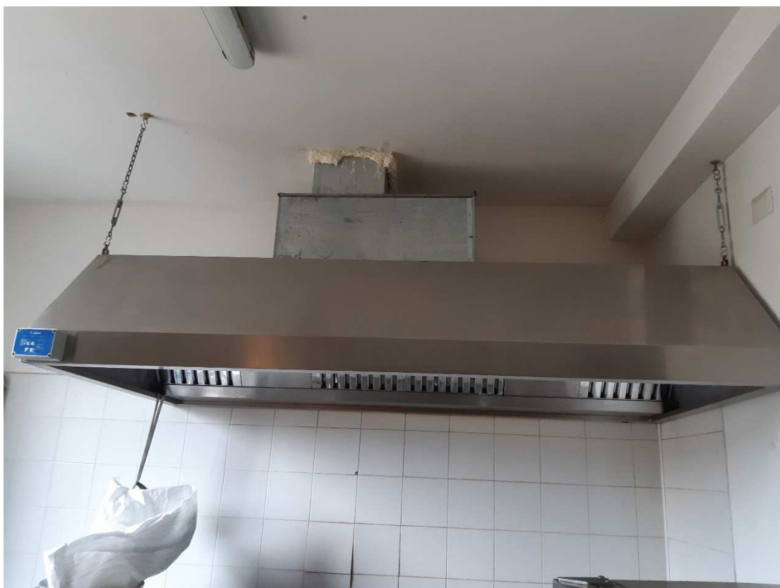
CAPPA ASPIRANTE PER CUCINA