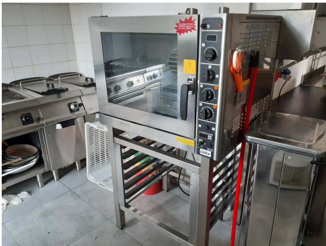
FORNO RIVALENTE 6 TEGIE CON MOBILE DI SUPPORTO