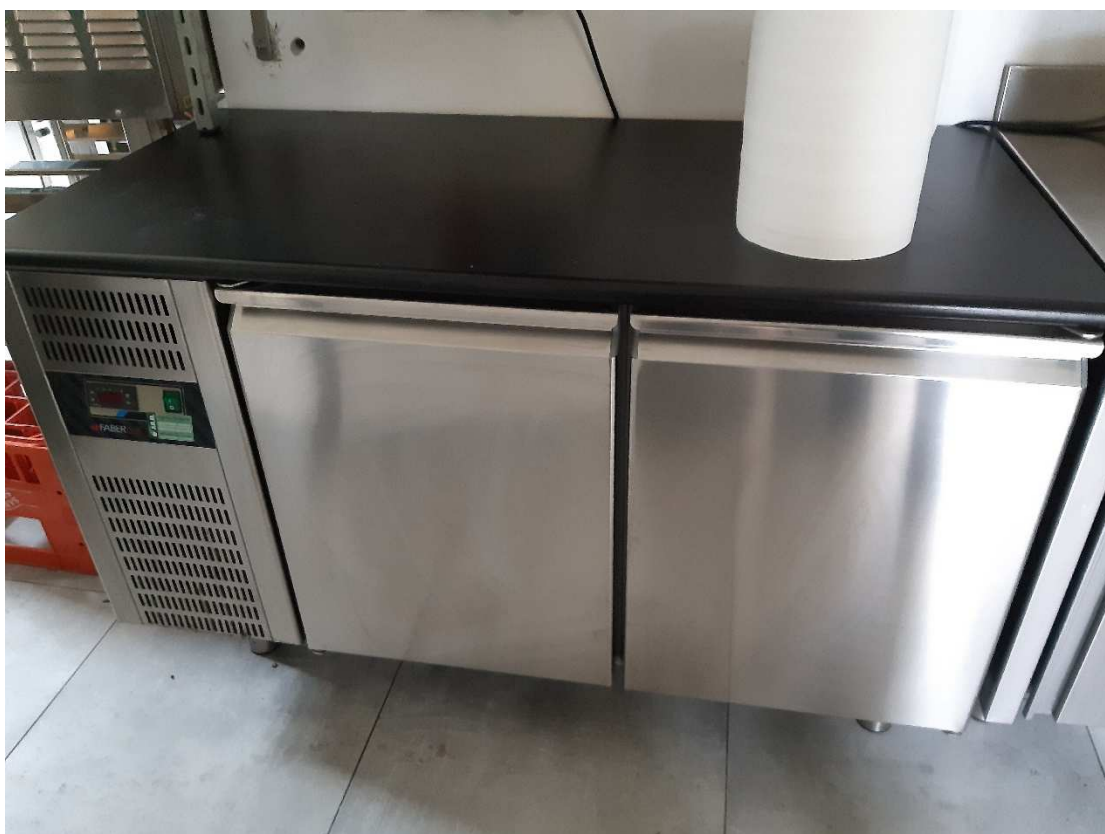
MOBILE FRIGORIFERO CON TOP NERO