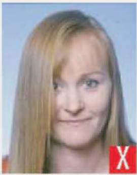
capelli sugli occhi