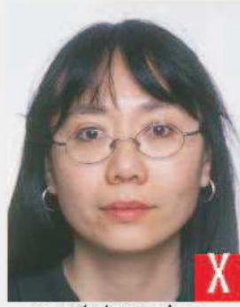
montatura che copre gli occhi