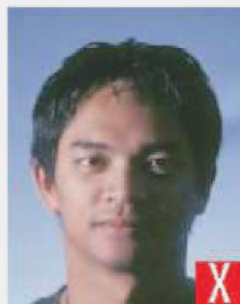
ombre sul viso