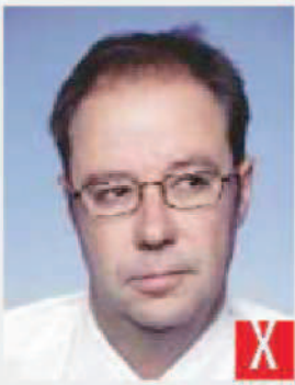
sguardo rivolto di lato