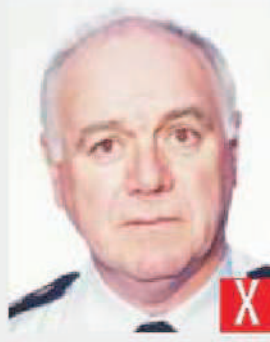
effetto occhi rossi