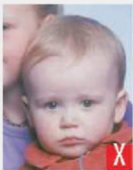
presenza di altra persona