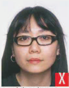
montatura troppo pesante