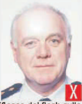
riflesso del flash sulla pelle