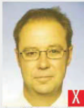
tonalità innaturale della pelle