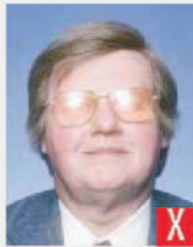
riflesso del flash sulle lenti