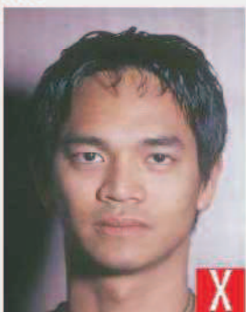
ombra dietro la testa