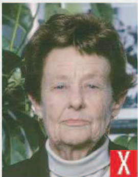
sfondo non a tinta unita