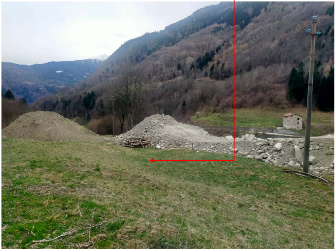
Vista fotografica 11

Area in cui sarà depositato il materiale