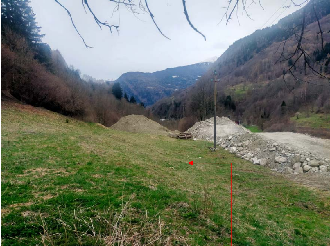
Vista fotografica 10

Area in cui sarà depositato il materiale