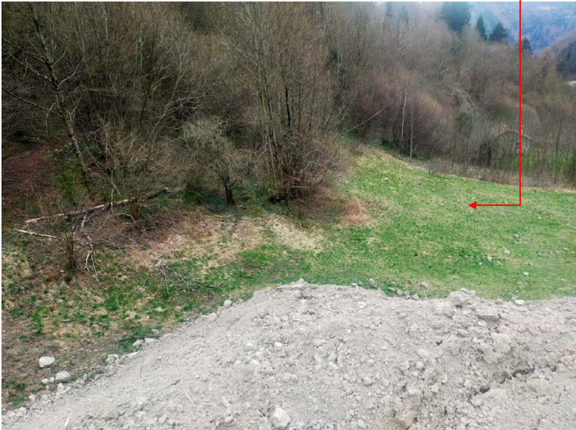
Vista fotografica 13

Area in cui sarà depositato il materiale