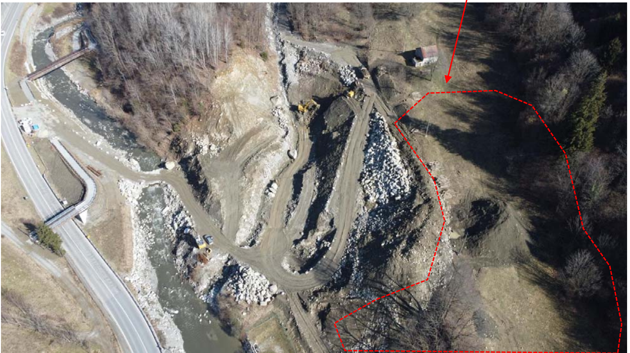
Vista fotografica 7: rilievo fotografico effettuato dall'alto con il drone

Area in cui sarà depositato il materiale