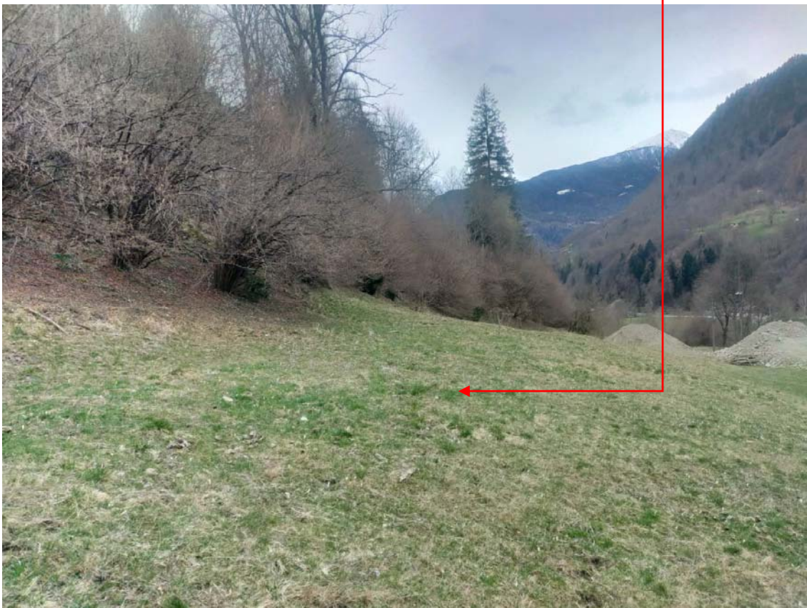
Vista fotografica 9

Area in cui sarà depositato il materiale