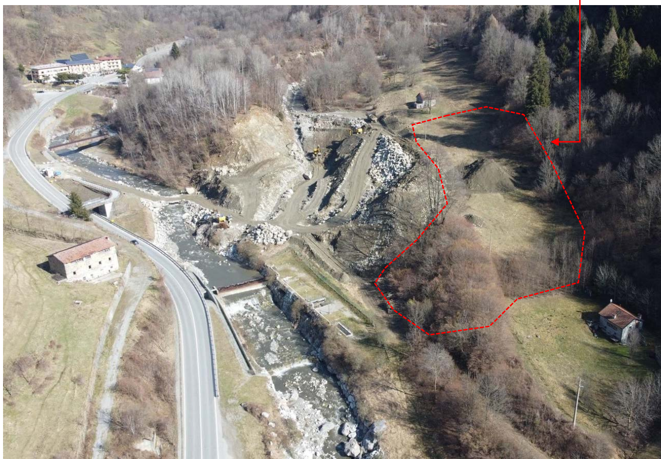
Vista fotografica 1: rilievo fotografico effettuato dall'alto con il drone

Area in cui sarà depositato il materiale