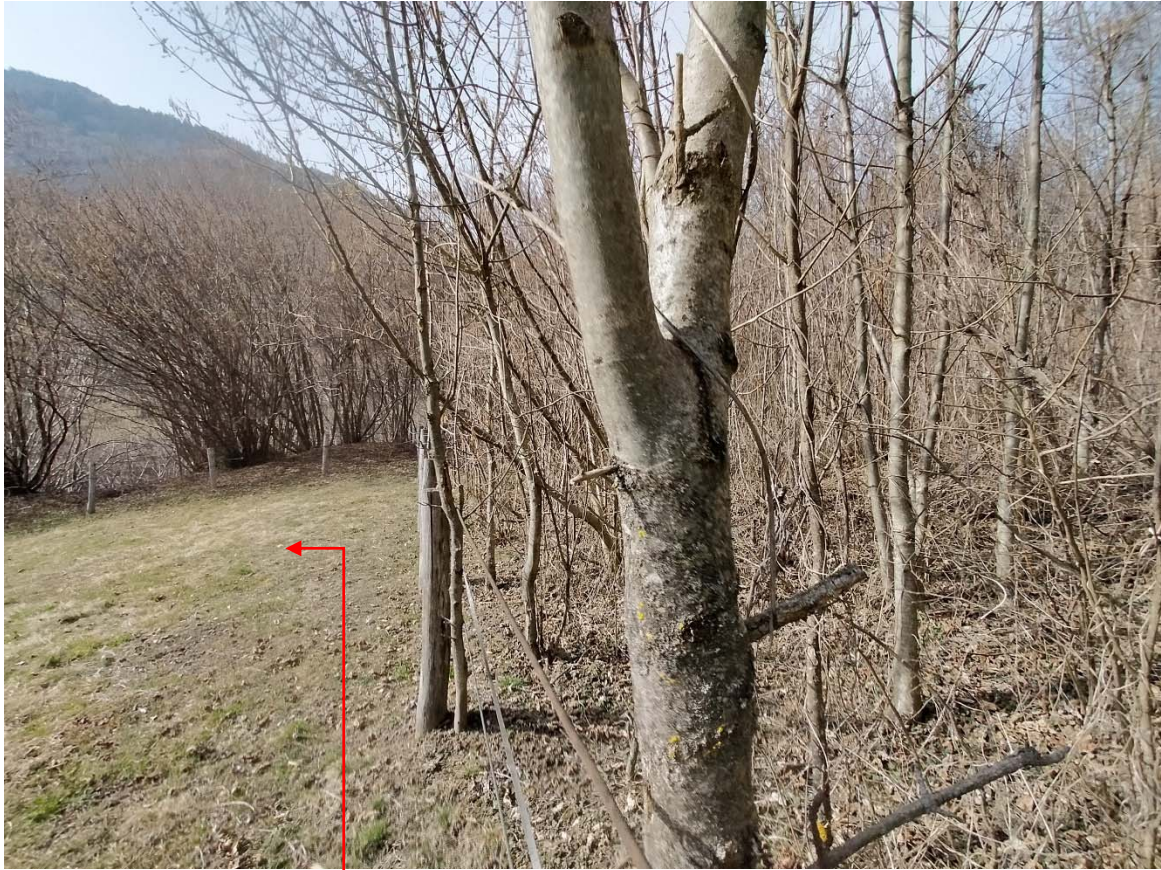
Vista fotografica 4

Area in cui sarà depositato il materiale