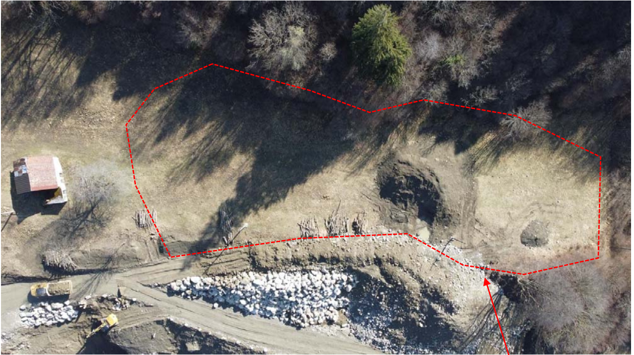
Vista fotografica 6: rilievo fotografico effettuato dall'alto con il drone

Area in cui sarà depositato il materiale