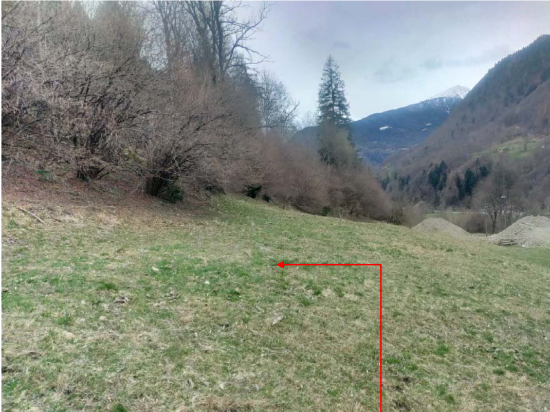
Vista fotografica 8

Area in cui sarà depositato il materiale