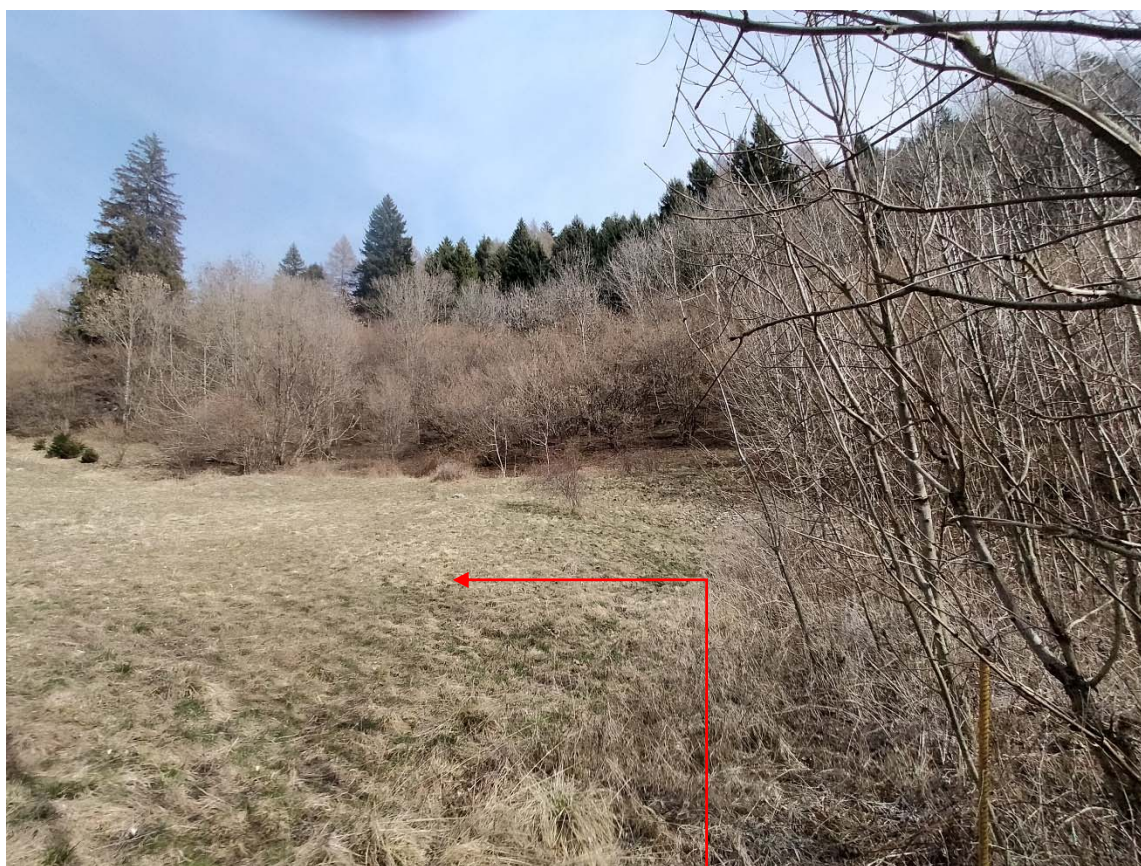
Vista fotografica 3

Area in cui sarà depositato il materiale