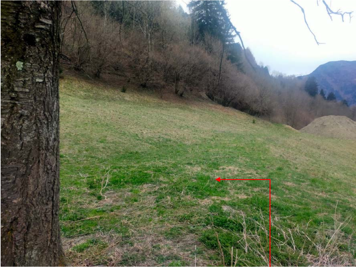
Vista fotografica 12

Area in cui sarà depositato il materiale