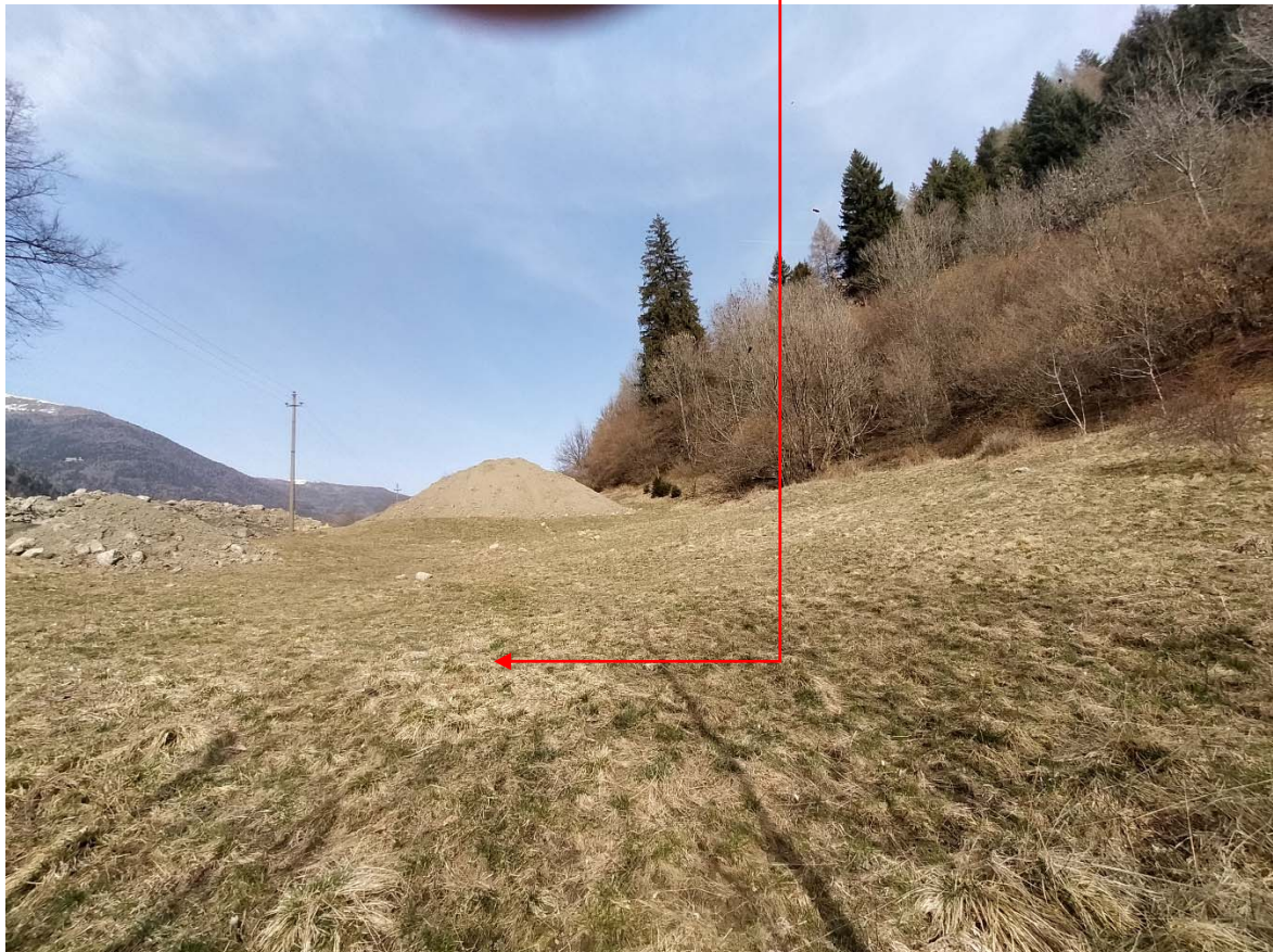
Vista fotografica 5

Area in cui sarà depositato il materiale