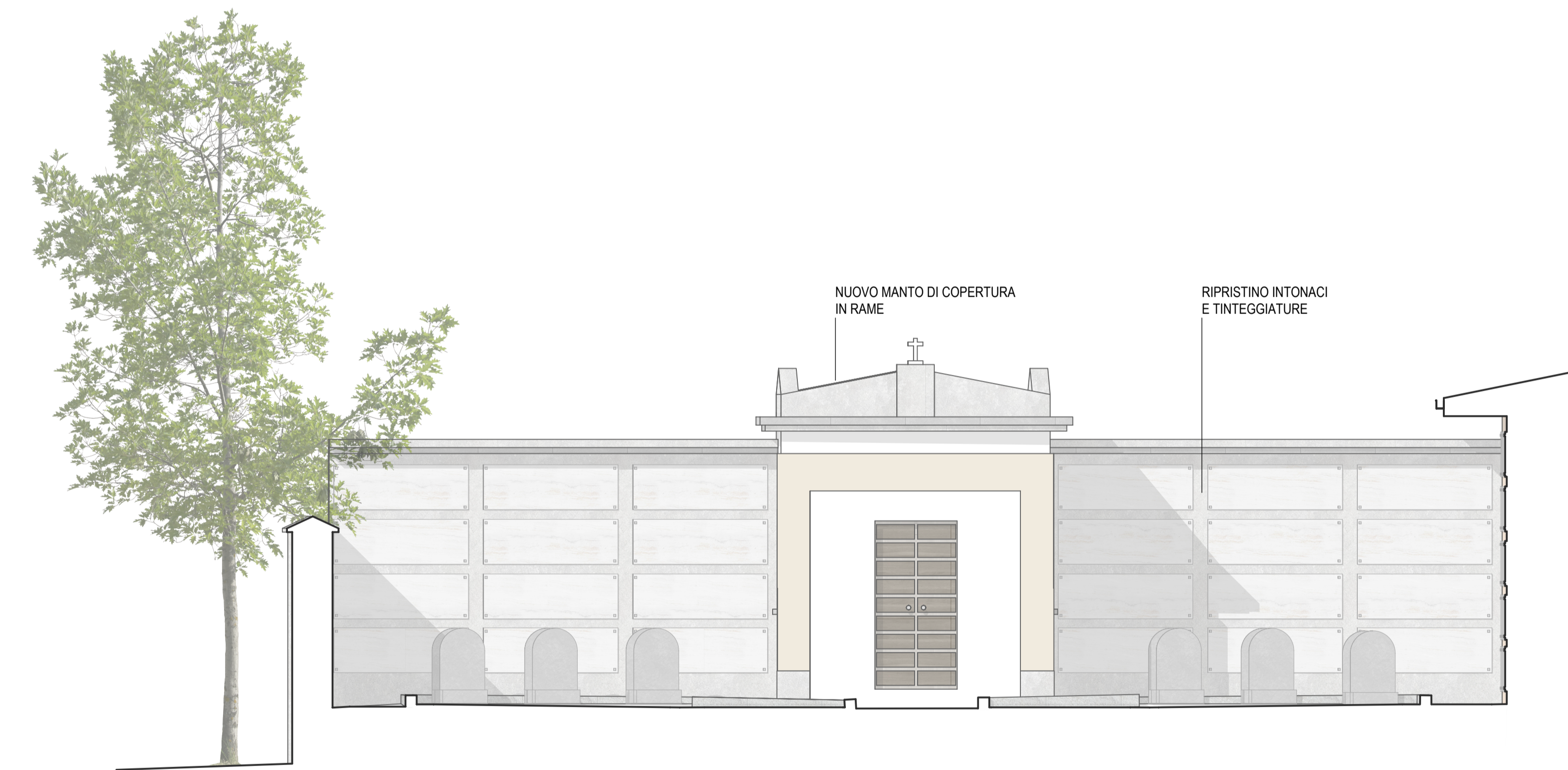
PROSPETTO NORD - Scala 1:50