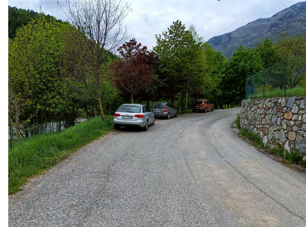
Fotografia n. 2: Area di accesso