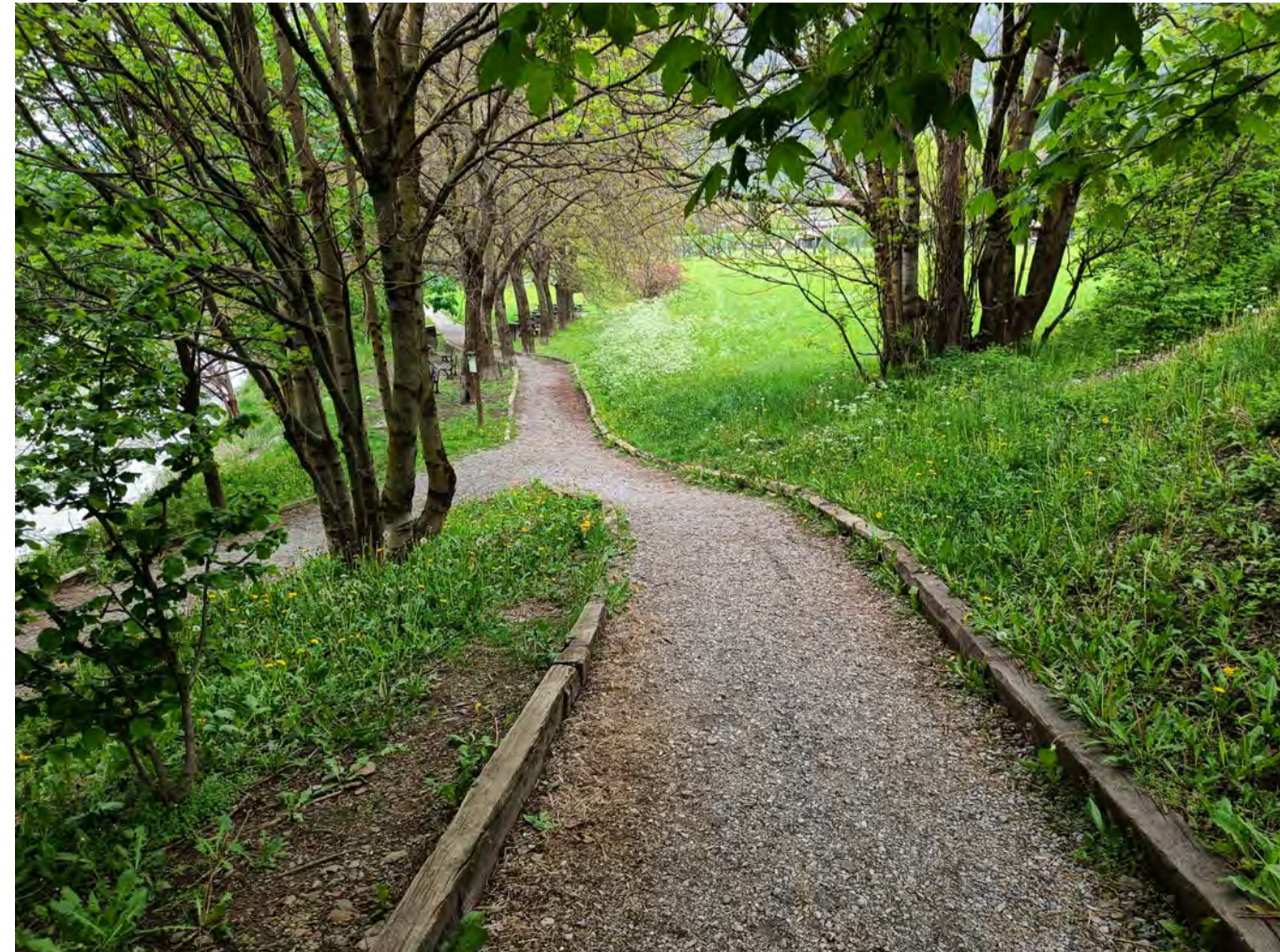
Fotografia n. 4: Attuale tracciato