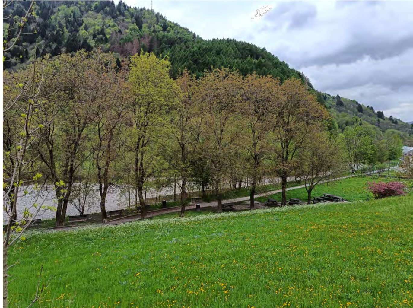
Fotografia n. 6: area di intervento vista da Nord