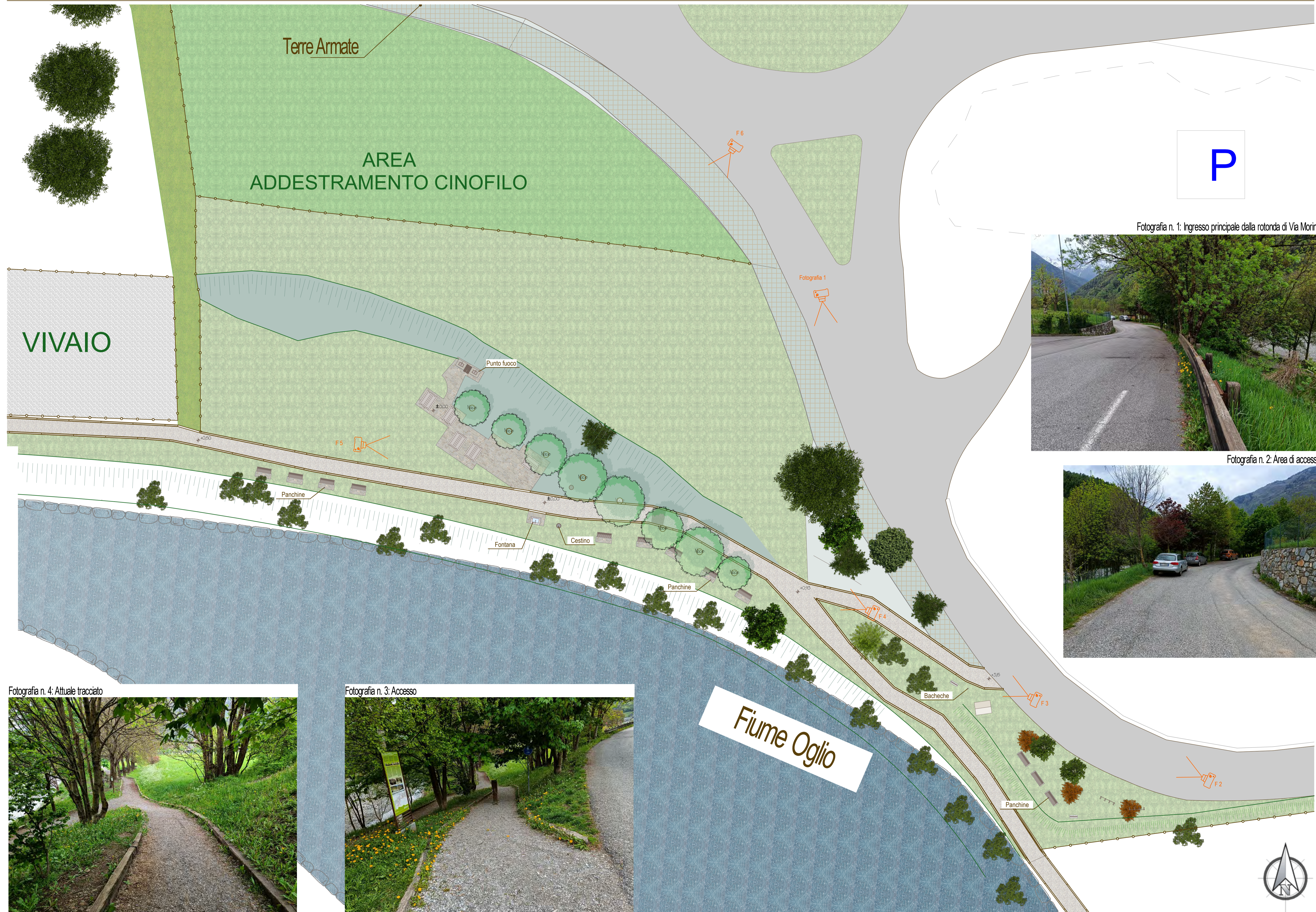
Fotografia n. 1: Ingresso principale dalla rotonda di Via Morino